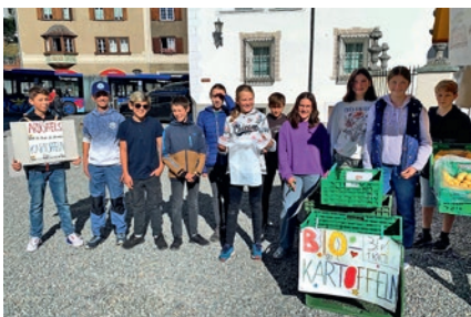
... und der Verkauf auf dem Markt