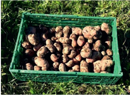
... die Ernte ....