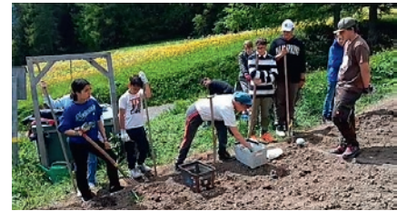
Der Anbau...die Pflege und das Wachstum...

... planter, chürer, racoglièr, cuschiner u vender ardöffels, que haun bgers iffaunts da la scoulina e dal s-chelin ot pudieu reviver quist an. In meg da quist an haun la seguonda classa dal s-chelin ot e la scoulina Gravatscha miss giò ardöffels i'l champ da «La Senda», mnedas da lur personas d'instrucziun. Ils ardöffels sun gnies racolts i'l tard utuon da la scoulina Gravatscha e da la prüma reela. Tenor tradiziun ho üna gruppa da scoulars e scoularas da la prüma secundara, cun agüd da la seguonda reela pudieu vender ils ardöffels düraunt l'ultim marchu evnil sün piazza Planta.